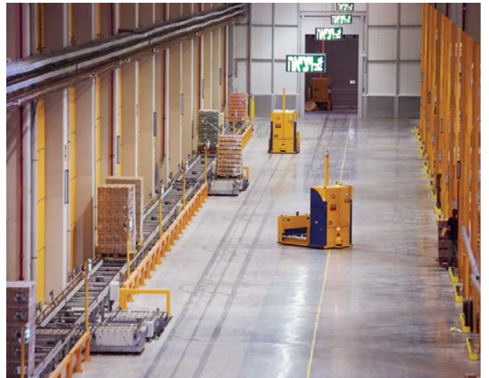
כלי-שינוע מונחים אוטומטית, שמחדשים את המלאי באזור הליקוט