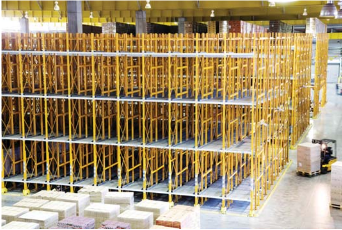
אזור האחסון של מוצרים מהירים

את פעילות הקבוצה. לכן הוחלט על הקמת קריית אסם - מרלו"ג, שיספק מענה ההולם את צורכי העתיד.