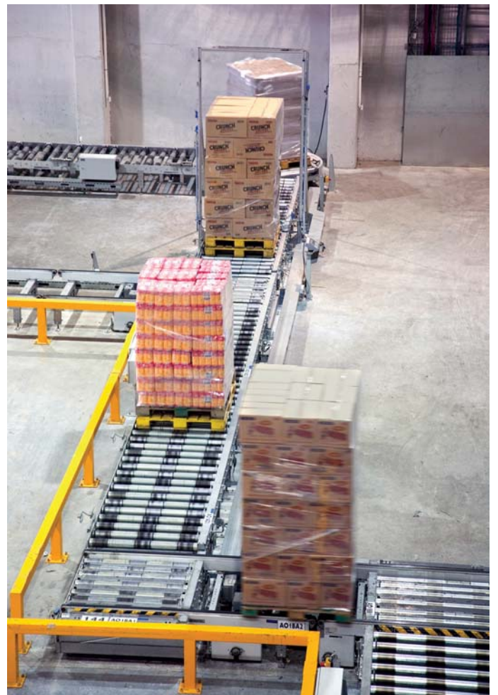
שער הבדיקה, שבוחן כל משטח לפני הכנסתו למחסן האוטומטי

"המרלו"ג מנוהל באמצעות מערכת שליטה ובקרה מתקדמת, המכילה כמה רבדים, כגון: מערכת המחשוב המרכזית של אסם, מערכת לניהול מחסן (WMS) (Warehouse Management System), מערכת ניהול הבקרים במחסן האוטומטי, ונוספת עליהן - מערכת לתכנון מיטבי של מסלולי ההובלה וההפצה. מערכת השליטה והבקרה מנהלת את המשימות ואת המלאי,