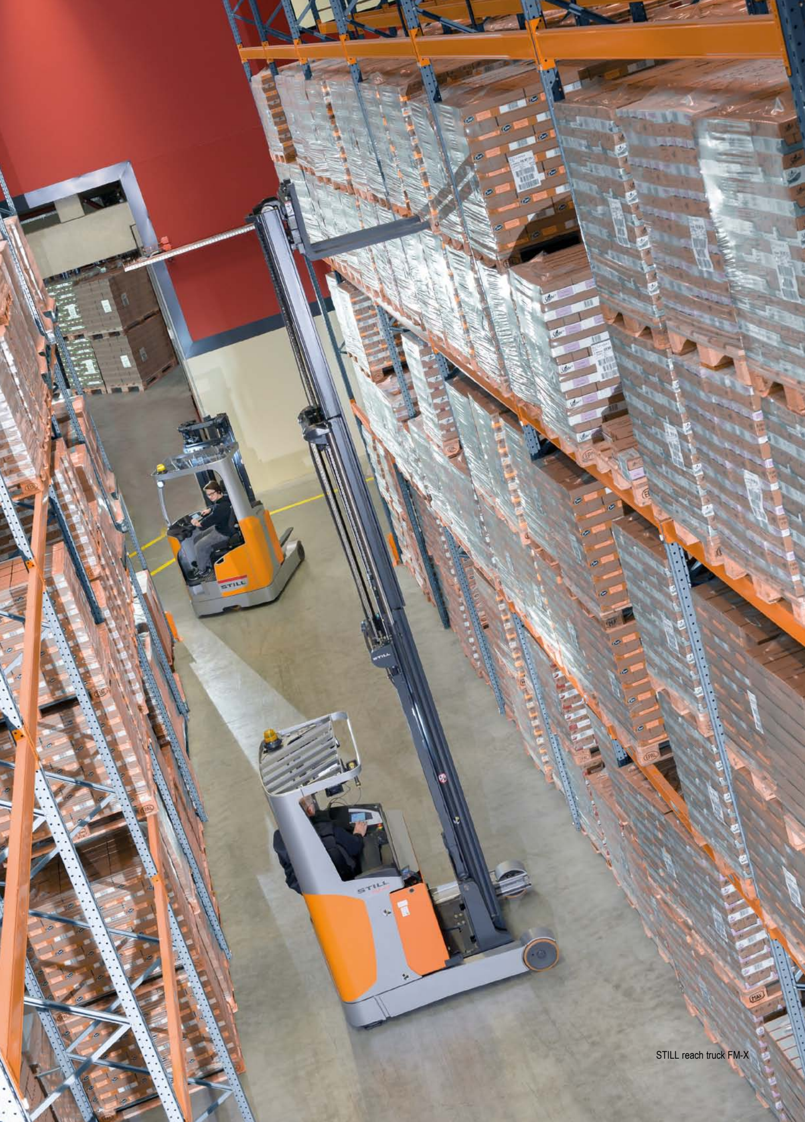
STILL reach truck FM-X