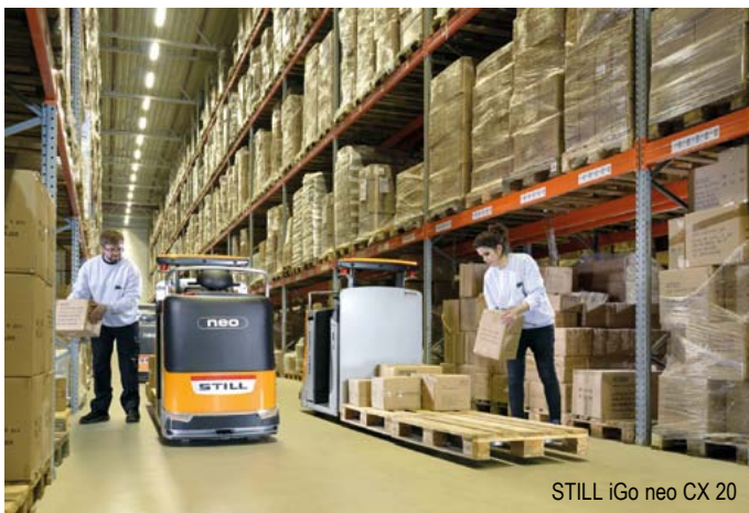
STILL iGo neo CX 20

לפרטים נוספים, צפו באתר: www.eagle-fl.com .