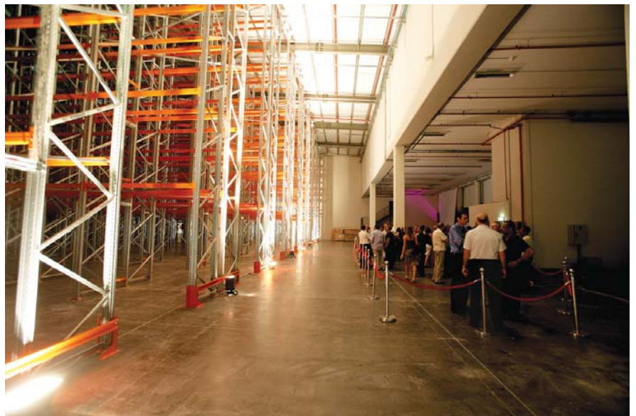
השקת מערכת קונבנציונלית לאחסון משטחים

מערכת קונבנציונלית לאחסון משטחים היא המערכת השכיחה ביותר בין המערכות לאחסון משטחים. יתרונותיה הם: גישה ישירה לכל משטח, מחיר נמוך למיקום משטח, וגמישות רבה בהתאמת המערכת למיגוון סוגי המשטחים