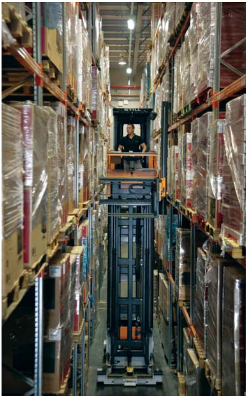
מלגזת צריח בין שתי שורות מידוף של המערכת