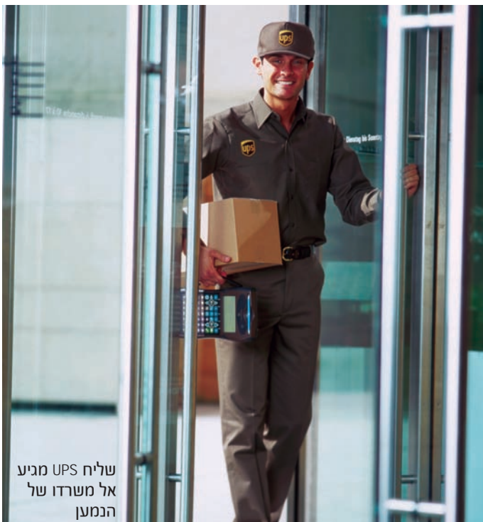
שליח UPS מגיע אל משרדו של הנמען

השירותים החדשים זוכים להיענות רבה מצד הלקוחות, ואלפי משלוחי freight כבר הגיעו ליעדם. אני צופה, כי הרחבת סל המוצרים ופתיחת עולם שלם של אפשרויות שילוח ולוגיסטיקה באוויר, ביבשה, וגם בים תחת קורת גג אחת - יהוו זרוע צמיחה משמעותית עבור UPS, וימשיכו למצב אותה כחברת השילוח המובילה בישראל. ■