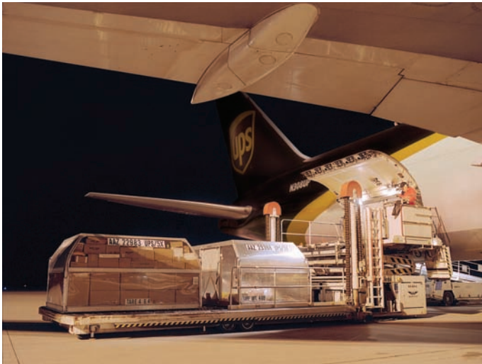
טעינת קונטיינרים על מטוס UPS

השירותים החדשים שמציעה UPS כוללים, בין היתר, בלדרות בינלאומיות, בלדרות פנים-ארצית, שילוח מטענים באוויר וביס, שירותי לוגיסטיקה ו-TPL, שירות עמילות מכס ושירותים נוספים. אחד מן הצעדים שנקטנו כמענה ההולם את הצמיחה הצפויה בעקבות הרחבת הפעילות בישראל היה הקמת מרכז לוגיסטי חדש, אשר ממוקם בשוהם. המרכז החדשני, אשר משתרע על 5,000 מ"ר עם קיבולת של עד 4,500 משטחים, מצויד במערכות טכנולוגיות מתקדמות, ומאפשר ללקוחותינו חיסכון משמעותי בעלויות ובזמנים, תוך שהם יכולים להתרכז בפעילות הליבה שלהם.