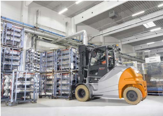
STILL RX 60-80

התפישה העסקית של חברת איגל מלגזות ולוגיסטיקה מבוססת על אספקת מוצרים איכותיים וחדשניים של היצרנים הטובים בעולם, ועל מתן פתרון כולל ללקוח לאורך כל מחזור חייו של הציוד. החברה מציעה ללקוחות מיגוון מסלולי התקשרות, התואמים את צורכיהם הייחודיים