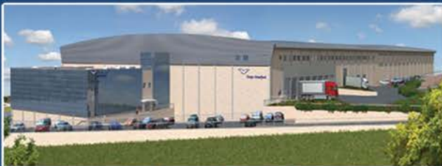
מחלף מחסנים - קרנו אמרפורד

ייעוץ לוגיסטי אסטרטגי ייעוץ לוגיסטי כלכלי - ROI ייעוץ לחברות 3PL אופטימיזציה של תהליכים לוגיסטיים