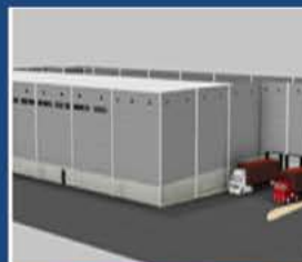
אורבן - עזריאלי