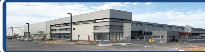
מרלוג אטליס - קבוצת זבידה