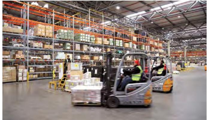
אחד מאזורי האחסון במסוף

החברות החדשות בחרו לעבוד איתנו, ובמקביל, חברות התעופה, שהצטרפו אלינו בתחילת הדרך, האריכו את הסכמי השירות לתקופות ממושכות לעומת המקובל בשוק. זו תעודת כבוד לאנשים שלנו, שהשקיעו את כל מאומם, כדי לספק שירות איכותי בסטנדרט הגבוה ביותר".