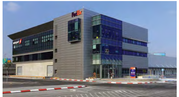
מסוף המטענים, סוויספורט בנתה לפדקס

"אחד מן הגורמים, החשובים במתן שירות, הוא השותפות עם הלקוחות. הם לבטח לא בחרו בנו בגלל המחיר, אלא בזכות העובדה, שיש להם על מי לסמוך. נציג סוויספורט יעמוד תמיד לשירותם (24/7), ובכל מקרה של תקלה, או של קושי, הוא יידע להבין את הצורך, ולתת ללקוח את הפתרון המיטבי", אומר שוחט. והוא מוסיף: "כחברה המעניקה שירות, אנו משקיעים בטיפוח המשאב האנושי וברווחתו, וגאים מאוד ביכולתנו לגייס עובדים ולשמרם. כאשר קיבלתי את תפקיד המנכ"ל, החברה העסיקה כ-200 עובדים, ו-25% מתוכם היו עובדי קבלן. כיום, היא מעסיקה כ-350 עובדים, וכולם הם עובדי סוויספורט ישראל. אולי זה מנוגד לתפישה הרווחת של ארגון 'רזה', אבל זכינו לקבל חברות אנשים עם מחויבות גבוהה ביותר לחברה. נוסף על-כך, אנו משקיעים מאמצים אדירים בפיתוח המקצוענות של העובדים, והם פועלים על-פי הסטנדרטים של Swissport International, המפעילה 133 מסופי מטען אוויריים בעולם. בשנים האחרונות, כל מערך ההדרכה עבר שדרוג משמעותי, והוא מתבסס על פלטפורמת 'סוויספורט פורמולה'. הפלטפורמה מפרטת את הסמכות העובד, מאפשרת לו לדעת מה הן הדרכותיו הקודמות, מה הם ציוניו, איזו הסמכה עומדת לפוג, וכו'. אנו מקיימים הדרכה שנתית לכל העובדים במרכז ההדרכה שלנו, וכן הכשרה בתחום החומרים המסוכנים ללקוחות מן החוץ".