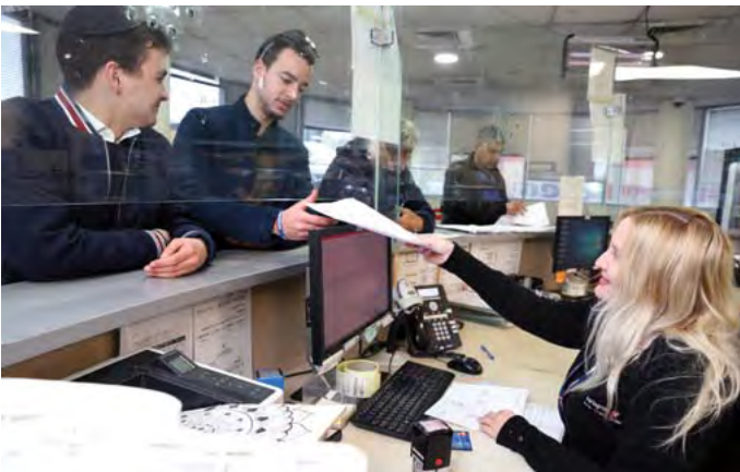
שירות מכל הלב!

לפרטים נוספים צפו באתר: www.swissport.co.il