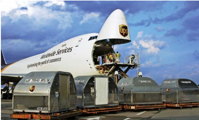
מטוס UPS וקונטיינרים אוויריים

להלן נתוני הפעילות של UPS בשנת 2014***: הכנסות (Revenue): 58.2 מיליארד דולר (לעומת 55.4 מיליארד דולר בשנת 2013). הכנסה נטו (Net Income): 3.03 מיליארד דולר. כמות עובדים (Employees): 435 אלף (מהם: 354 אלף בארה"ב ו-81 אלף במדינות מחוץ לארה"ב). כמות כלי-רכב: כ-106 אלף (כאשר יותר מ-5,000 מכלי-הרכב מונעים באמצעות אנרגיה חלופית). צי-המטוסים כולל כ-650 מטוסים, והיא חברת התעופה התשיעית בגודלה בעולם! נוסף על-כך, UPS מפעילה כ-1,990 נקודות תשתית (Operating facilities) ברחבי העולם. במהלך שנת 2014, החברה מסרה 4.6 מיליארד חבילות ומסמכים (Packages and documents) (ממוצע יומי: 18.0 מיליון), והיא סיפקה שירות ל-9.8 מיליוני לקוחות.